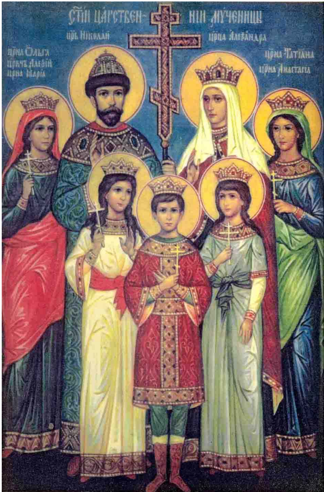
СВЯТЫЕ ЦАРСТВЕННЫЕ МУЧЕНИКИ