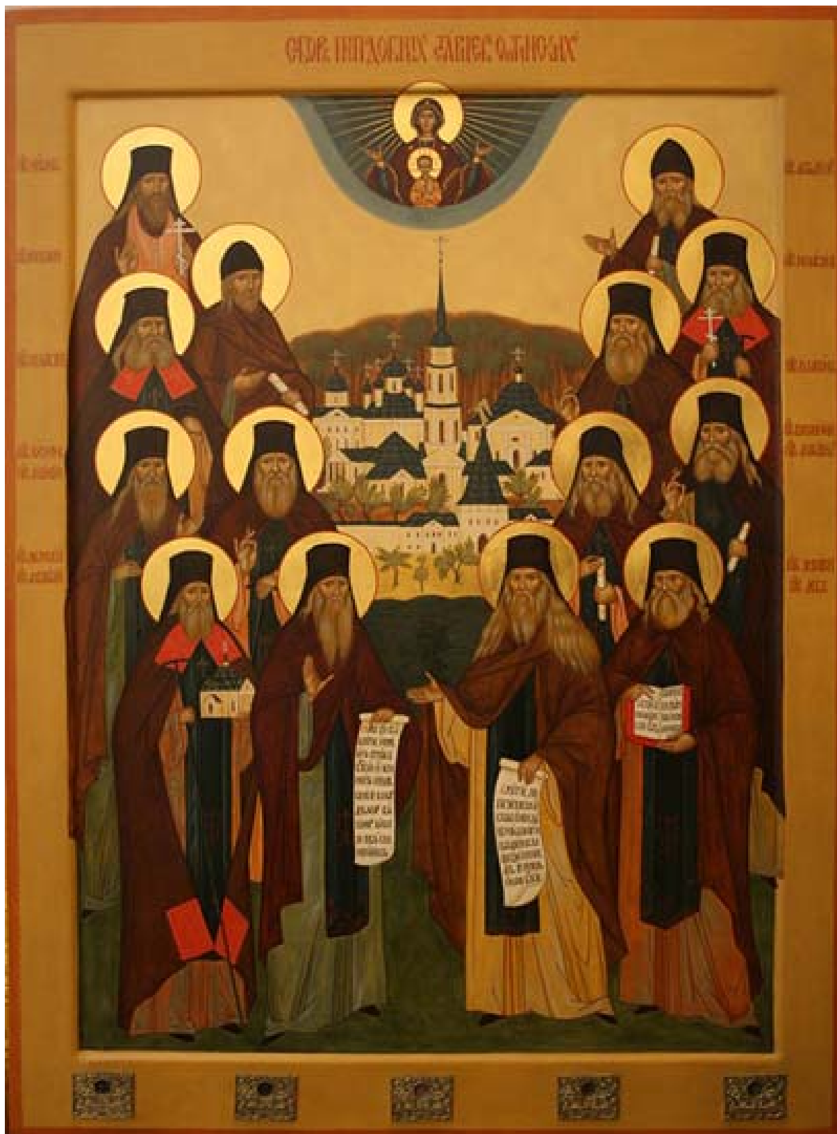
СОБОР ПРЕПОДОБНЫХ СТАРЦЕВ ОПТИНСКИХ