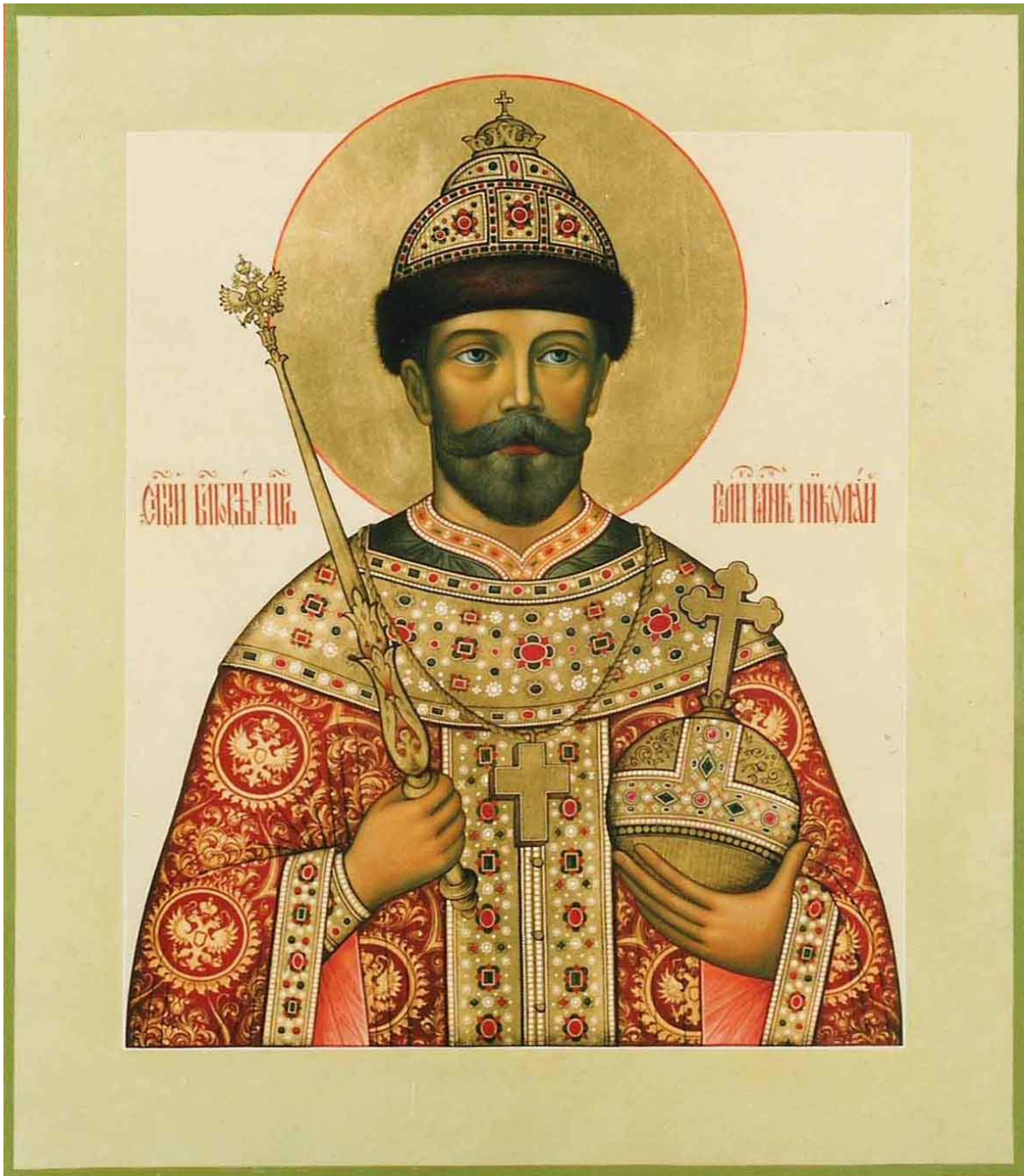
СВЯТОЙ ЦАРЬ МУЧЕНИК НИКОЛАЙ