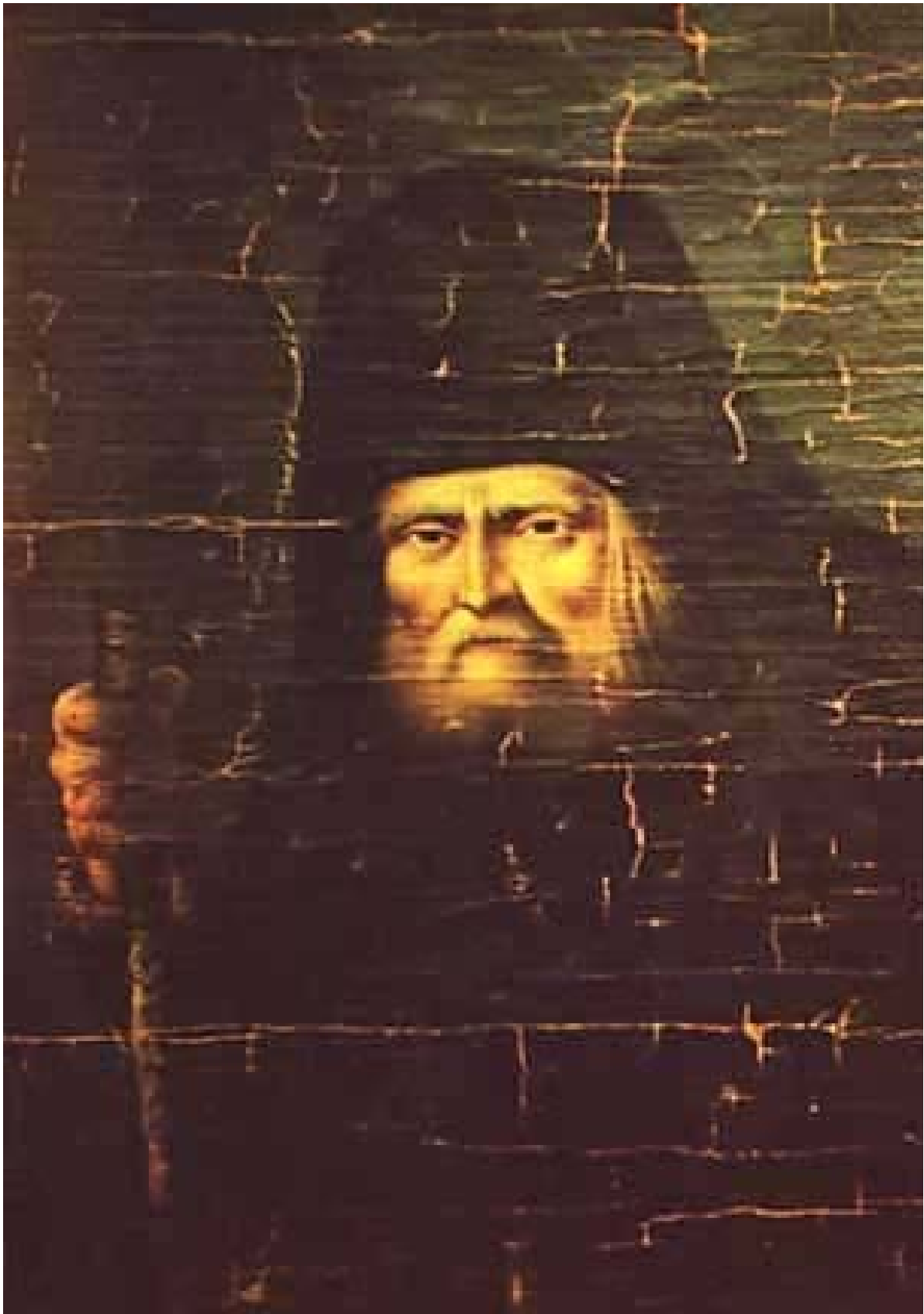
СВЯТОЙ ПРЕПОДОБНЫЙ СЕРАФИМ САРОВСКИЙ