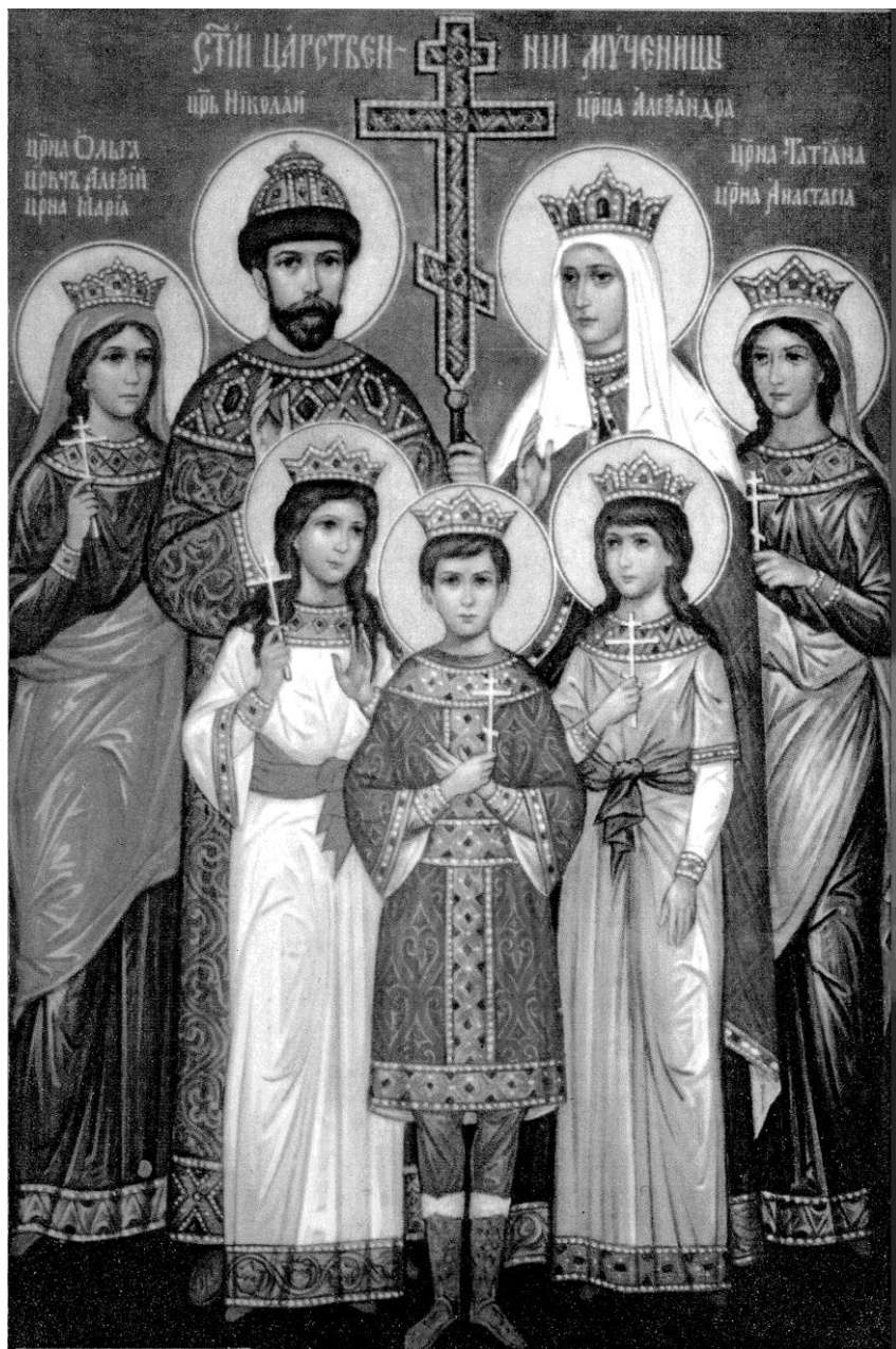
Чудотворный образ Святых Царственных Мучеников